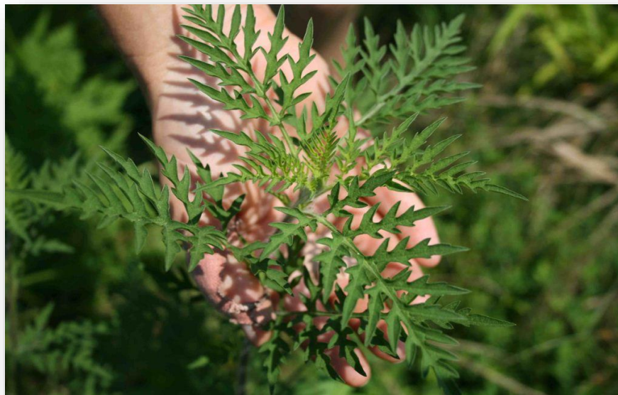
STADIU DE PREÎNFLORIRE