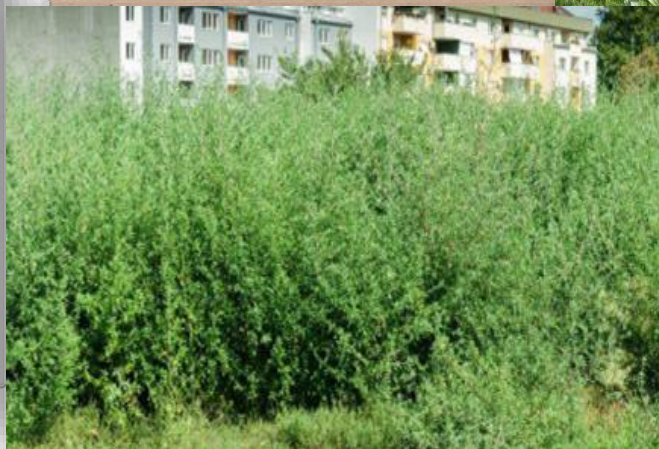
AMBROZIE PE LÂNGĂ UN ȘANTIER ÎN CONSTRUCȚII