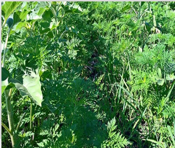
AMBROZIE ÎN CULTURA DE FLOAREA-SOARELUI , sursa foto: