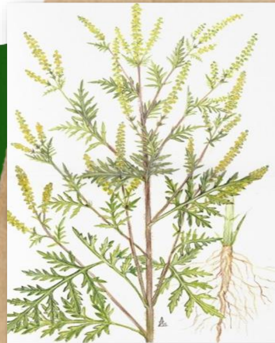
Ambrosia - rădăcină, tulpină, frunze, inflorescențe, sursa foto: https://www.mesageruldesibiu.ro/leacuri-din-natura-ambrosia-ambrosia-artemisiifolia/