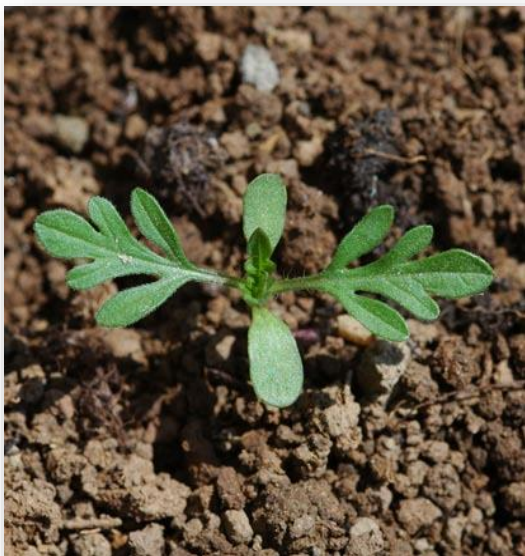
PLANTULĂ DE AMBROZIE