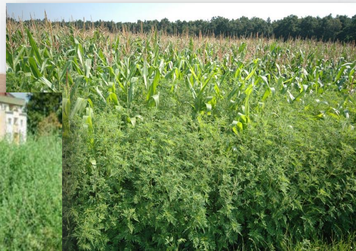
AMBROZIE ÎN CULTURA DE PORUMB , sursă foto:

https://www.ms.ro/ro/documents/311/ambrozia_pr_ezentare_si_combatere.pdf